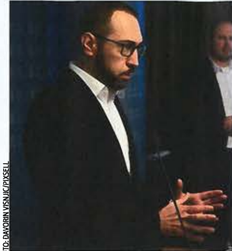
▼ TRŽIŠNO NATJECANJE NA PODRUČJU OGLAŠAVANJA U GRADU ZAGREBU NI NA KOJI NAČIN NIJE NARUŠENO; NACIONALU JE ODGOVORENO IZ SLUŽBE ZA INFORMIRANJE UREDA GRADONAČELNIKA

NACIONAL JE U POSJEDU PRESUDE Visokog upravnog suda i odluke Ustavnog suda. Iz njih je razvidno da je Europlakat još u veljači 2010. Ustavnom sudu podnio prijedlog za pokretanje postupka ocjene suglasnosti s Ustavom i zakonom Odluke Grada Zagreba o izmjenama i dopunama Odluke o određivanju djelatnosti koje se smatraju komunalnim djelatnostima gradskog značaja iz 2008. Ustavni sud je 2012. taj predmet svojom odlukom preputio Viskom upravnom sudu. Godinu kasnije, taj sud je ukinuo članak 1. stavak 1. odluke Grada Zagreba o određivanju djelatnosti koje se smatraju komunalnim djelatnostima u dijelu koji glasi: „5. Usluge oglašavanja na javnim površinama i na nekretninama u vlasništvu Grada Zagreba“. Dakle, sudskom presudom jasno je potvrđeno da se Grad Zagreb i tvrtke u njegovu vlasništvu ne mogu baviti uslugama oglašavanja na javnim površinama